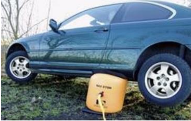
E-4 ábra:

Nehéz tárgyak emelésére különböző eszközöket, emelőkart, csigát, különféle mechanikus és más emelőket használnak. Az E-4 ábrán egy szokatlan emelővel megemelt gépkocsit láthatunk. A pneumatikus, hasáb alakú, levegővel felfújható párnaemelő szilárd, nem rugalmas gumiszövetből készül. A párnába kompresszorral, pumpával levegőt fújunk, esetleg a gépkocsi kipufogó gázait is használhatjuk.