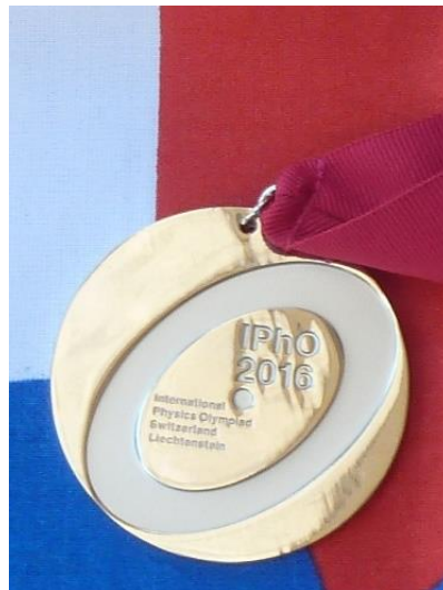
Obr. 2 - Strieborná medaila