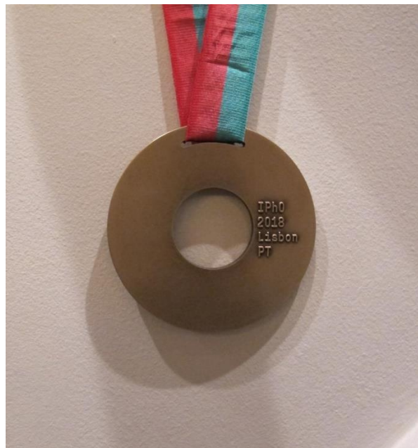
Obr. 2 - Bronzová medaila